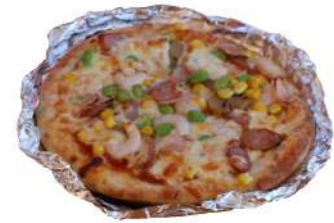
今年もピザ窯大活躍でした♥

今年も多くのお施主様にお越しいただきました！ありがとうございます☺ 皆様の思い出の中に楽しい一日として残っていれば嬉しいです♪ そんなあの日を少しでも振り返りましょう(^)/☆☆☆