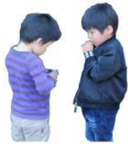
子供レフリー発見★