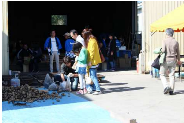
目指せじゃがいも5キロ!