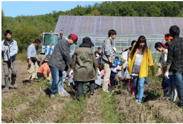
お天気にも恵まれました☀