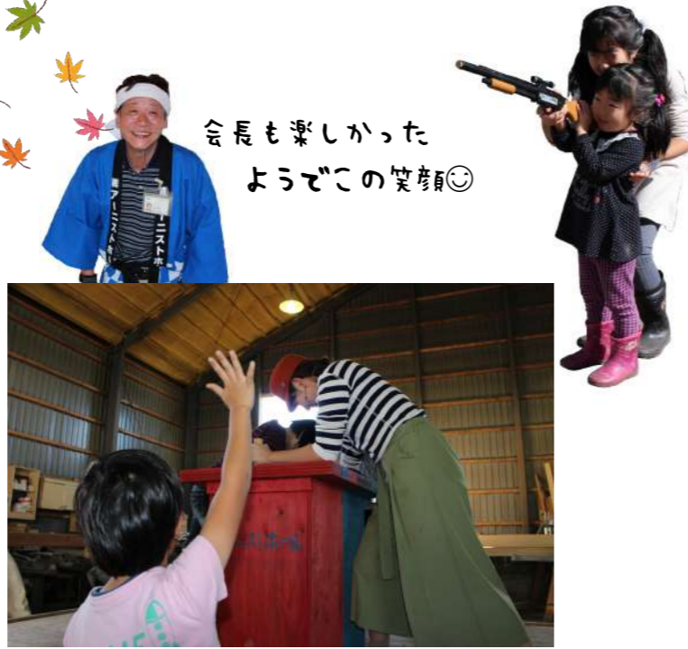
会長も楽しかった ようでこの笑顔☺