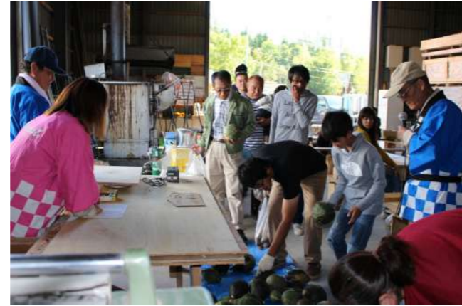
重量当てはピタリ賞も!!!